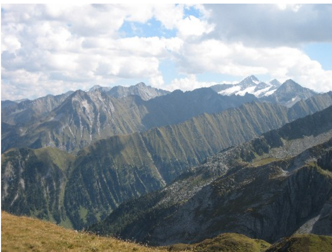
Pfad zum Torhelm